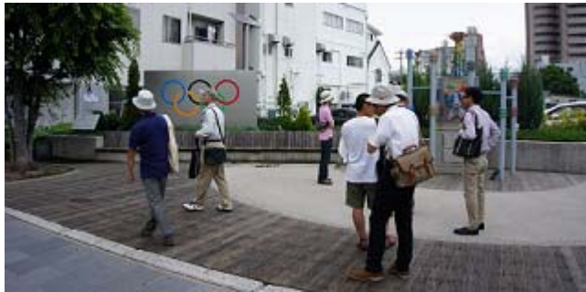
セントラルスクエア(長野オリンピック表彰式会場跡地)