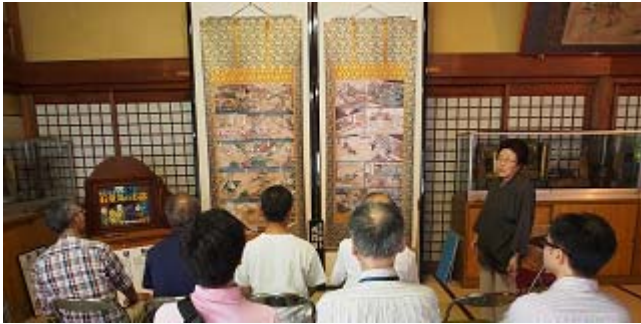
西光寺にて「絵解き(紙芝居の原形)」を体験