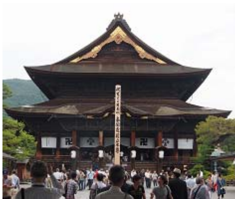
御開帳が終わったばかりの善光寺