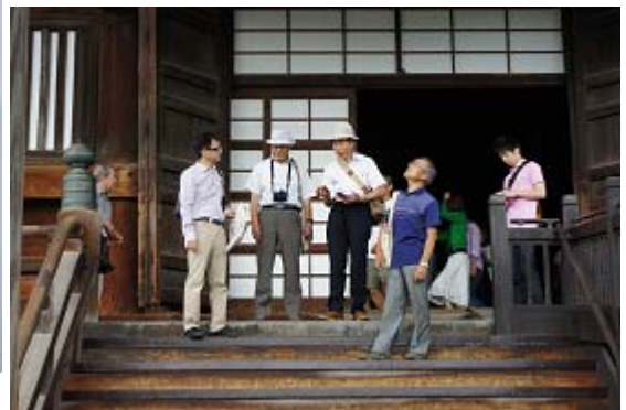
石黒氏の説明に耳を傾ける