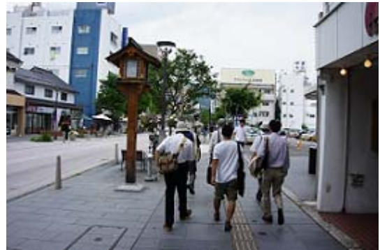
表参道を善光寺へ