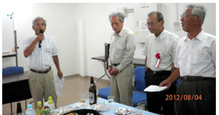
ト部様リードで関東八州唱和