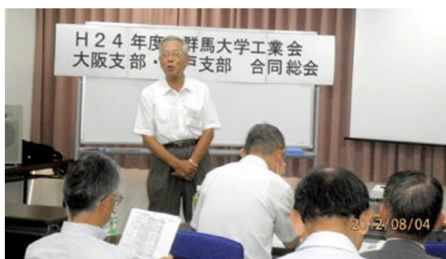
御園神戸支部長挨拶