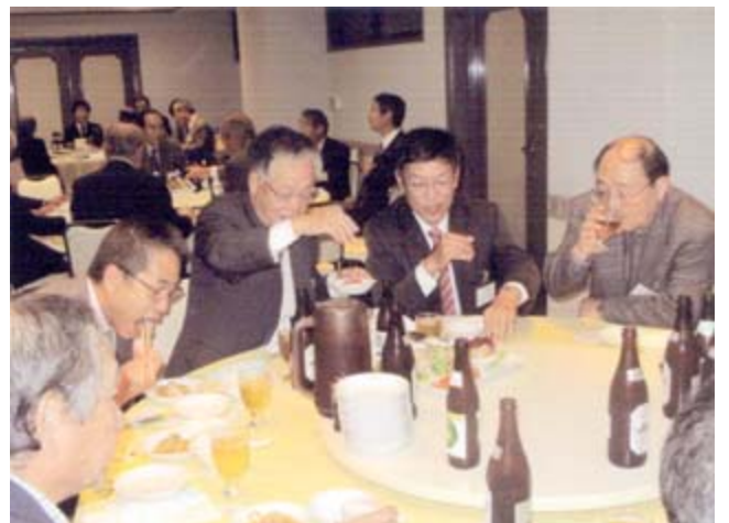
盛大に懇親の会話がはびむ