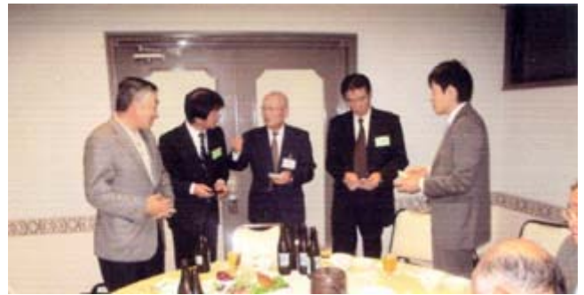
石原支部長と富岡市職員名詞交換し歓談