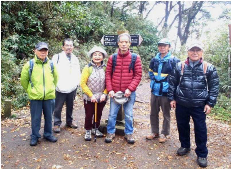
天園ハイキングコースから鎌倉湖方面分岐点