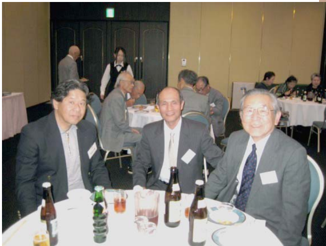
関東八州を高らかに