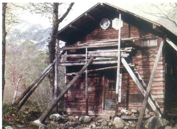
昭和45年大修理のころの仙之倉山荘

雪の深い山荘で一番の楽しみの夕食はよく造ったが、卒業真近の合宿には家から麺棒を持参して、山行から早く帰った日を選んで、うどんを打って上州の「煮込みうどん」を作った。凸凹だらけのテーブルの上で、12人分のうどんを打つのは大仕事だった。