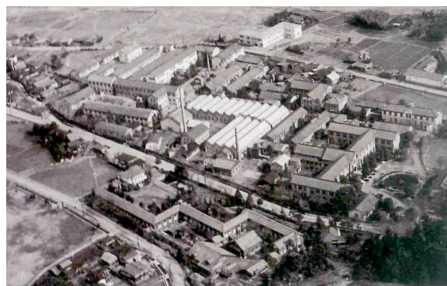
同窓記念会館移転前の学舎（昭和31年ころ）

こうして入った大学生活は、新しい学問を学び、学習に更に熱中した仲間との交流、そして山岳部の未知の分野での仲間との共同生活、今思い返しても全ての環境にまっしぐら