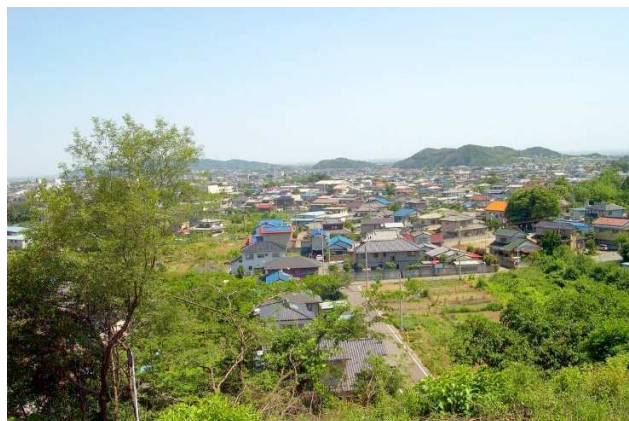
故郷みどり市大間々町早川貯水池からの展望

こうして問題の残る卒業をしたが、やがて、前述の誤回答があったにもかかわらず、たった一度の受験で目的の会社に就職が決まった。いよいよ東京に出発、母は見送りが辛く、出て来なかったが、今までどこに行くにも決して見送りをしてくれなかった父が何も言わずに家の前に立った。ごく軽く挨拶をして駅まで約200メートルの道を歩きながら時々振り返ると、手も振らずじっとこちらを